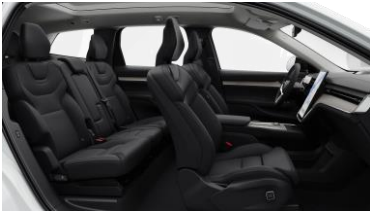
Charcoal Nordico in Charcoal interior