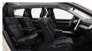
Ventilated Charcoal Nordico in Charcoal interior