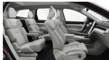
Ventilated Dawn Nordico in Dawn interior